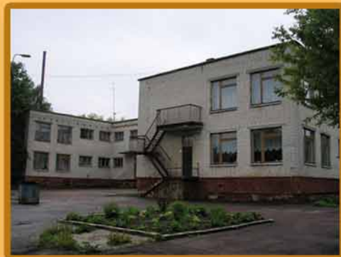
בנין בית ספר חב"ד בצ'רניגוב, אוקראינה

בחודש תמוז תש"ס, לפני 6 שנים מענדי עדין לא נולד. הגענו לצ'רניגוב לקראת חג-השבועות תש"ס, ומיד התחלנו עם ההכנות לפתיחת בית-ספר חב"ד בעיר. כל האנשים שהיינו עמם בקשר, אמרו שזה מאד קשה, כי צריך להשיג הרבה אישורים והפרט המסבך ביותר - לשכור בנין לבית-הספר, ובזמן כ"כ קצר, זה בודאי לא אפשרי. החלטנו בכל אופן לנסות לפתח את בית-הספר והתחלנו לעבד במרץ. בתחלה הכל התקדם כמתכנן, ילדים נרשמו לבית-הספר, מצאנו כבר מנהלת שהתחילה לראון