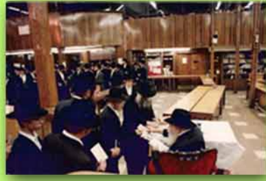
השליח הרב שנאור קוט מקבל $2 לצדקה בסיומה של יחידות כללית לבחורים.

בשנת תשנ"ב הייתי בחג הסכות אצל הרבי. ביום הראשון של החג, הרבי נתן לכל החסידים לברך על הלולב שלו, כל החסידים עמדו בתורות ארפים שנמשכו לכל אורך הרחוב ליד 770, וכל אחד בתורו ברח על הלולב. לכל אורך הזמן הזה, עמד הרבי במשך 8 שעות ארפות והסתפל איך כל אחד ואחד מברך על הלולב.