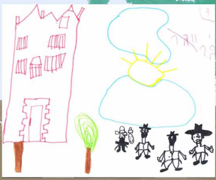
מאת: יחי וובר (5) דנייפר, אוקראינה