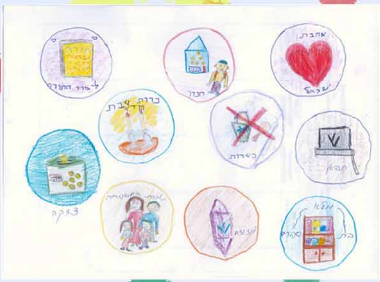
שפרה גלזמן (8) ריגא, לטביה