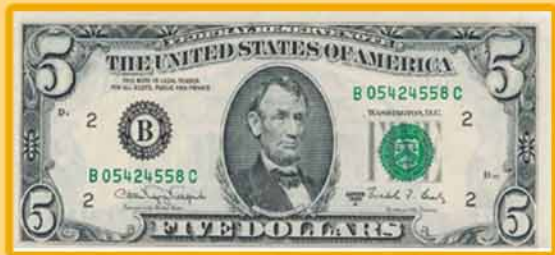
הדולר שקיבלתי מהרבי ביום חתונתי

יום חתונתנו יצא ביום ראשון. באותו יום הלכתי למעמד חלוקת דולרים של הרבי, לזכות ולקבל מהרבי דולר לצדקה ובכרה ביום חתונתי. הרבי נתן לי דולר ואמר "לתת בחתונה לצדקה". ואז הרבי נתן לי עוד דולר ואמר: "מהיום החמן שלך יימן לך כסף, אבל היום תתני לו!"