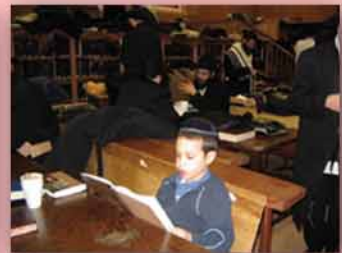
שליח הרבי לבוקרסט, רומניה מתפלל ב-770