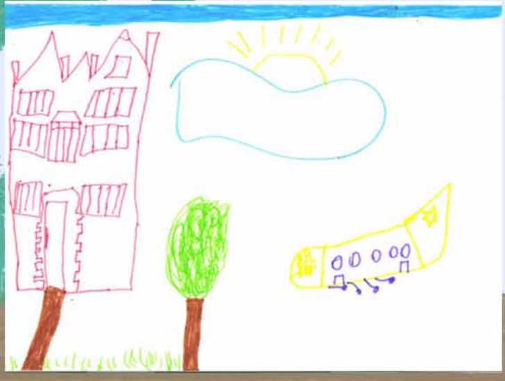
מאת: מענדי וובר בן (7) דנייפר, אוקראינה